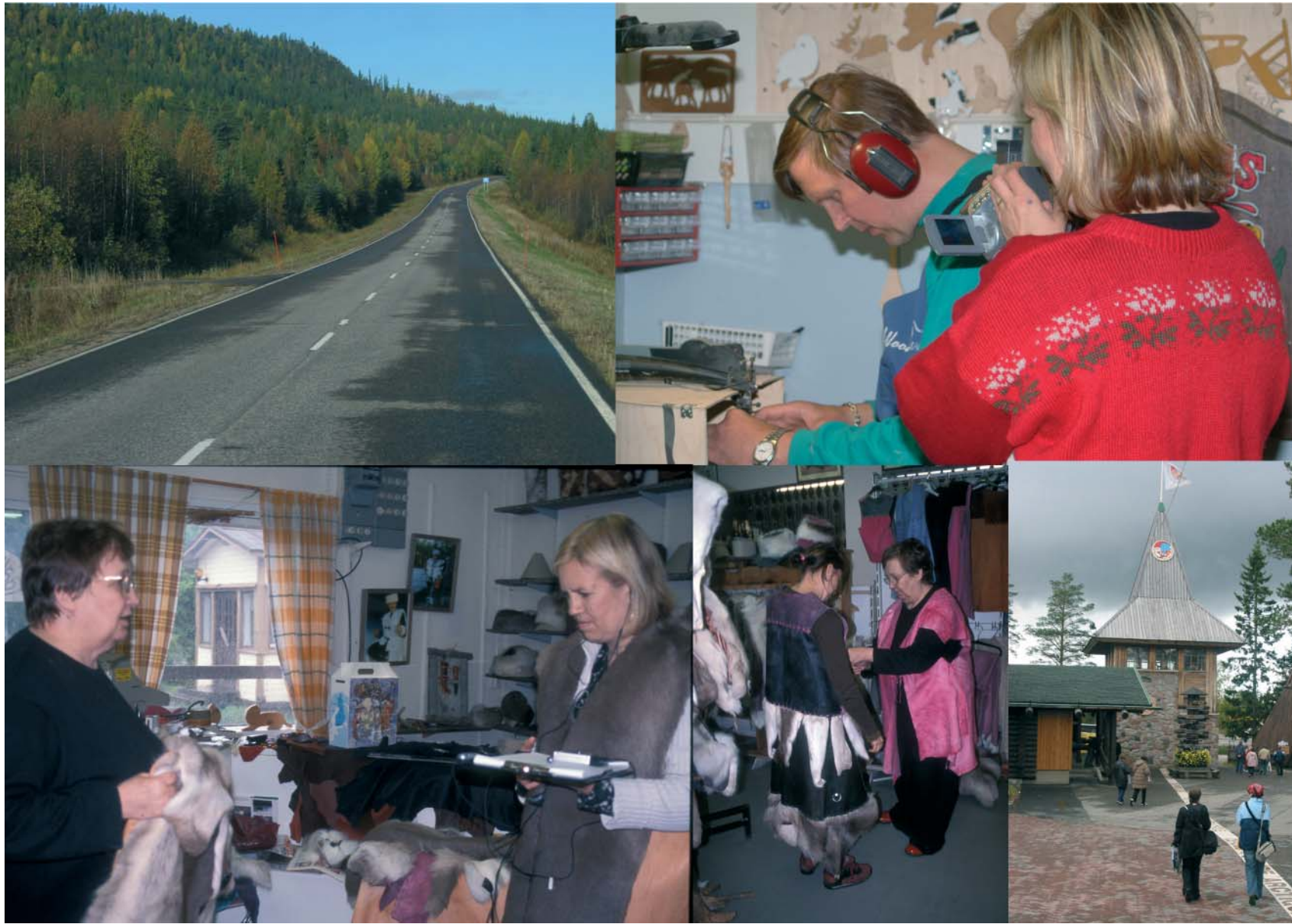
Kuvia ensimmäiseltä matkalta 2005